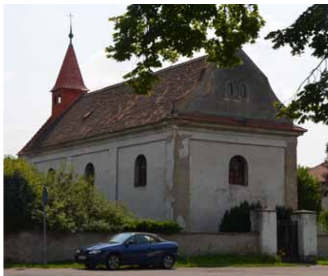
kostel sv. Máří Magdalény