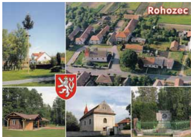
pohlednice vydaná roku 2007