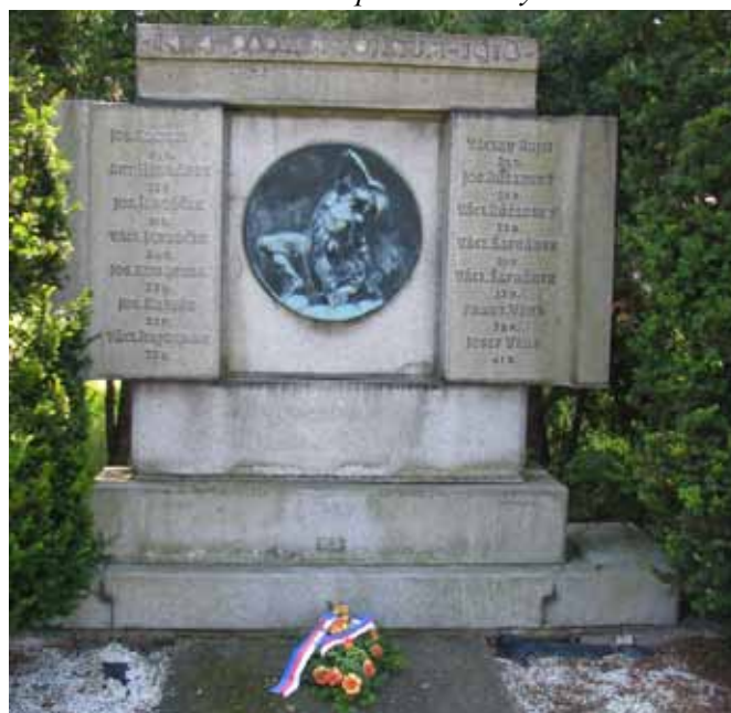
pomník obětí I. světové války